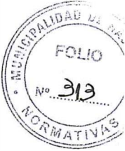
Olga B. Graciani Sec. de Gob. y Hacienda

Art. 3º) Regístrese, comuníquese, publíquese y archívese.-